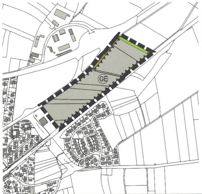
Abbildung 1: Geltungsbereich 4. Änderung des FNP Gewerbegebiet Marzling Ost (Vorentwurf)

Der räumliche Geltungsbereich umfasst die Grundstücke Flurnummern 533/2 Teilfläche, 608/1, 610/1, 611, 612, 613, 613/2, 613/3, 630/3, 630/4 Teilfläche, 630, 630/2, 632/1 und 631 Teilfläche der Gemarkung Marzling. Die Grundstücke befinden sich im Osten von Marzling zwischen der Bahnlinie München-Regensburg und der Freisinger Straße; östlich des Feuerwehrhauses.